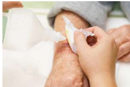
Cuidado de la Piel y Úlceras