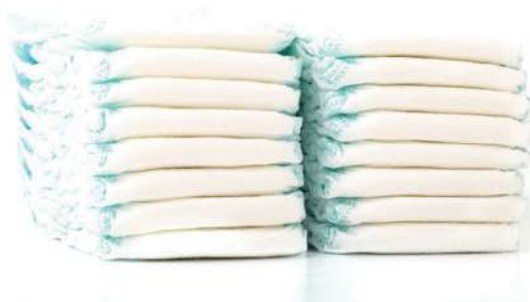
Variedad de Pañales, Underpads y Underpads en Tela