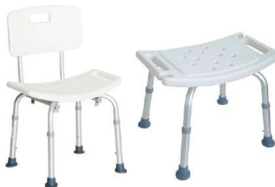
Variedad de Sillas de Baño Disponibilidad con y sin espaldar, y "transfer bench"