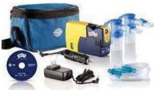
Compresor para Terapia Respiratoria Regular y Portátil